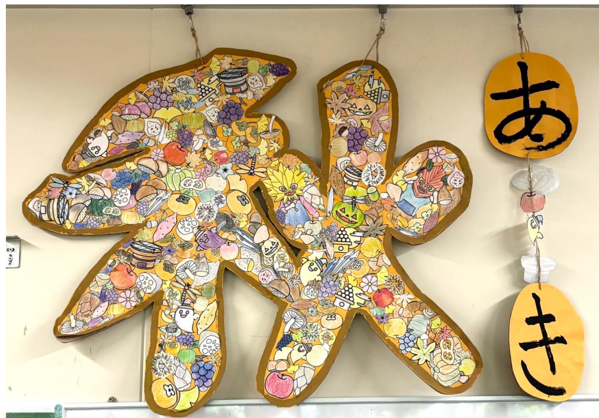
デイケア利用者様の作品